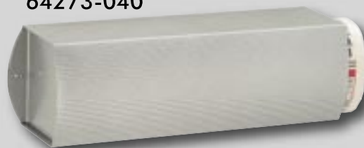
LA OLA-WAVE 64273-040

Zeitungsrolle "LA OLA-WAVE" aus pulverlackiertem Aluminium, Körper aus Feinwellblech, mit beidseitig verwendbarem Deckel 40,5 x 11,5 cm, H 12 cm; 0,6 kg 64273-040 diamantsilber