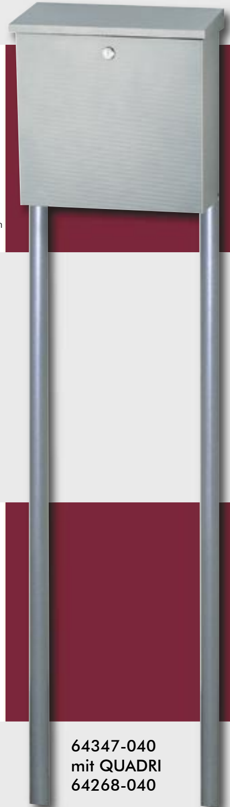
64347-040 mit QUADRI 64268-040

Accessories - order it separatly: 80188-040 sheet metal for assembling the letter-box 64268-040 80189-040 sheet metal for assembling the letter-box 64269-040