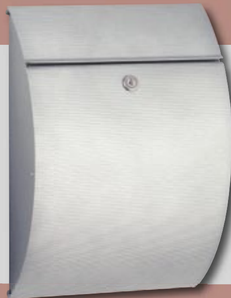
LA OLA-WAVE 64269-040

Briefkasten "LA OLA-WAVE" aus pulverlackiertem Aluminium, Türe und Klappe aus Feinwellblech, zu öffnen von oben nach unten, selbstklebendes, gravierfähiges Namensschild aus Aluminium, Einwurf C 4 hoch 32,5 x 12,5 cm, H 46,5 cm; 1,8 kg 64269-040 diamantsilber