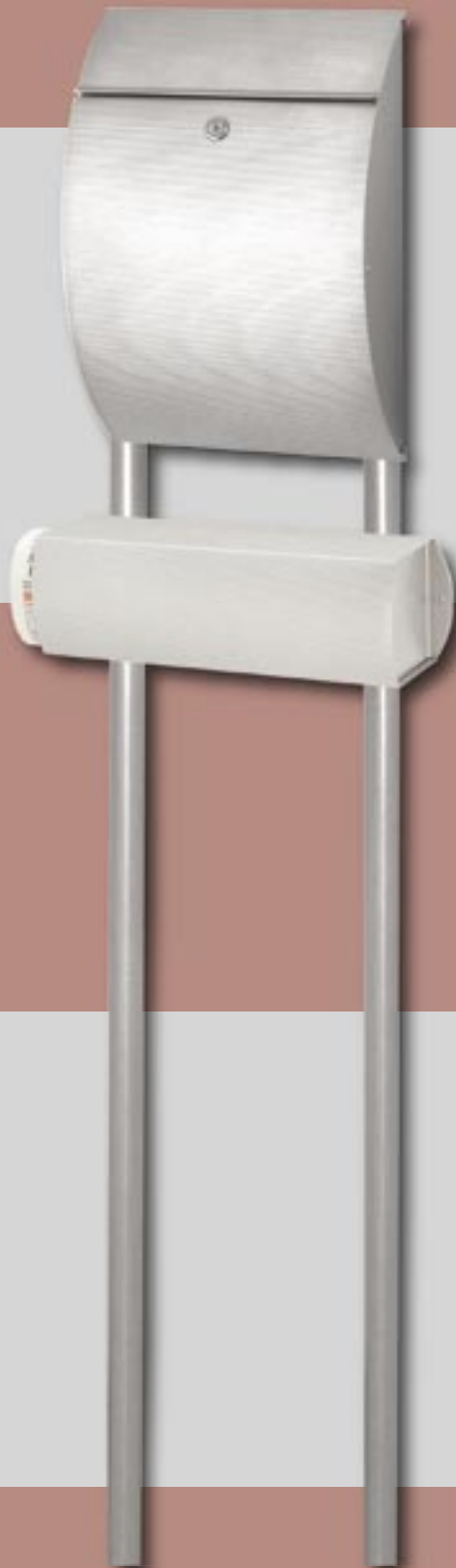
64347-040 mit LA OLA-WAVE 64269-040 und 64273-040

Briefkastenständer aus Edelstahl, pulverlackiert, bestehend aus zwei Röhren Ø 40 mm (inkl. Befestigungsschrauben), die mit dem Adapterblech verschraubt werden müssen